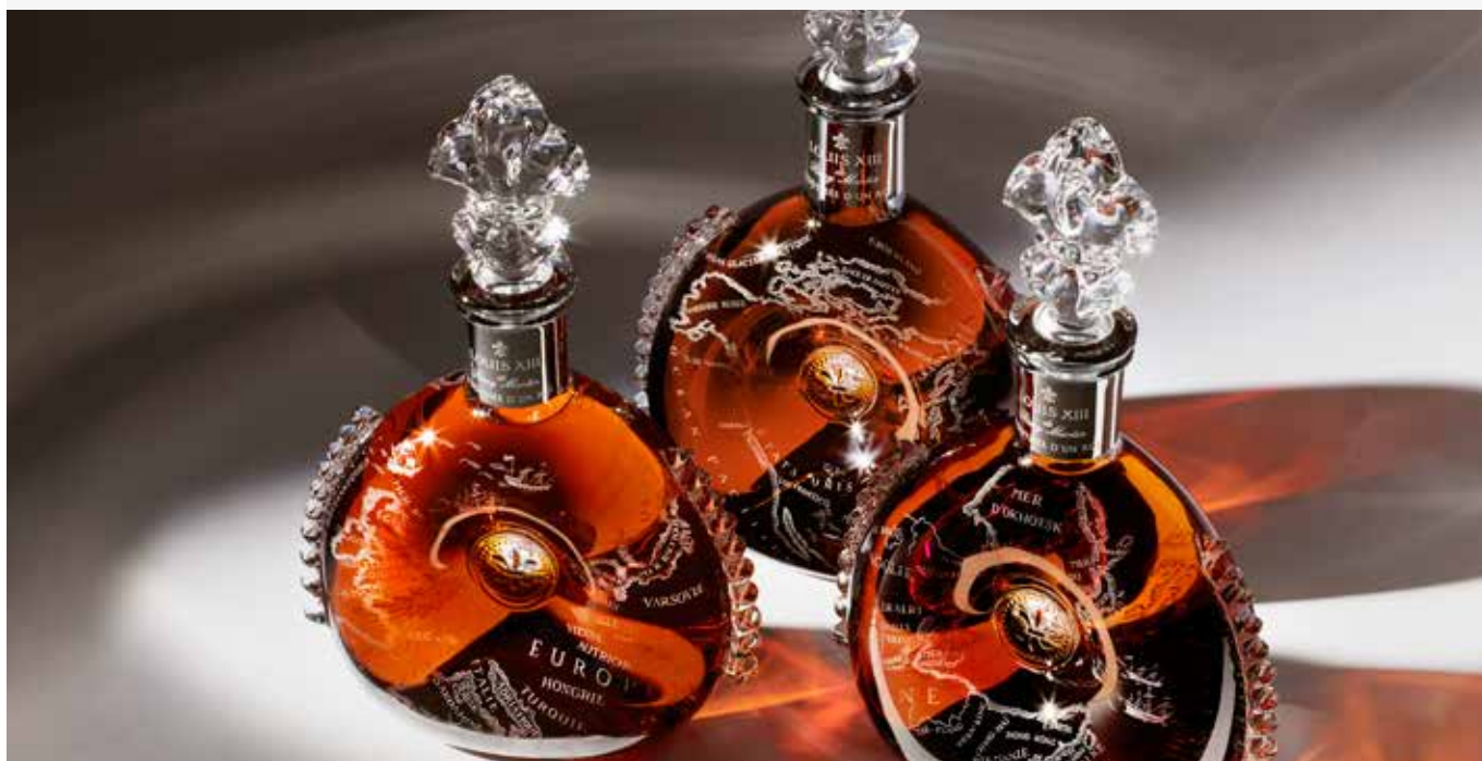
Trois carafes LOUIS XIII gravées pour le projet L'Odyssée d'un Roi.

Le ratio bancaire « dette nette/EBITDA » montre une nouvelle amélioration à 2,16 à fin septembre 2016 (contre 2,29 à fin mars 2016 et 2,53 à fin septembre 2015), en dépit d'une saisonnalité traditionnellement défavorable au 1er semestre.