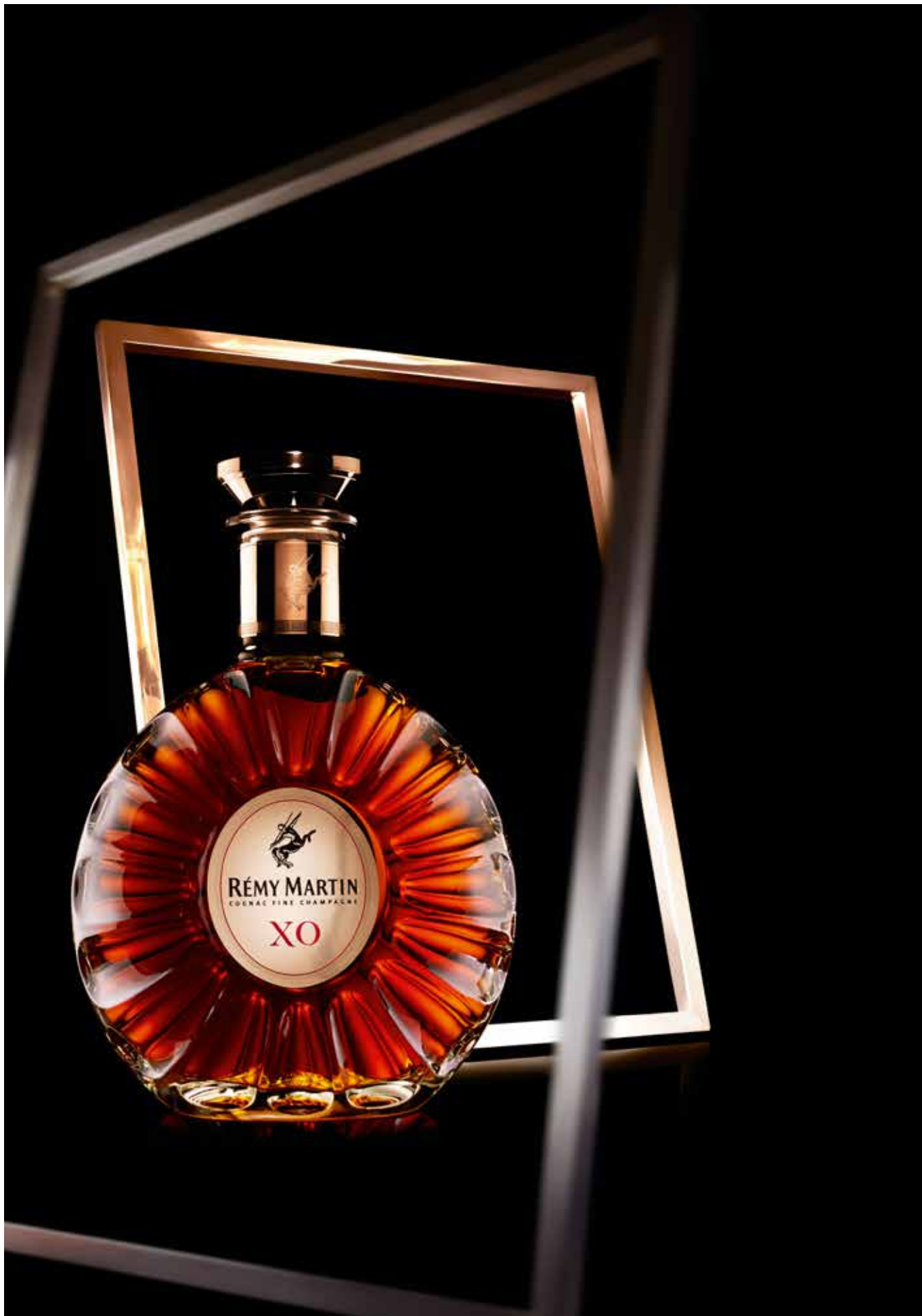
Nouvelle bouteille Rémy Martin XO.